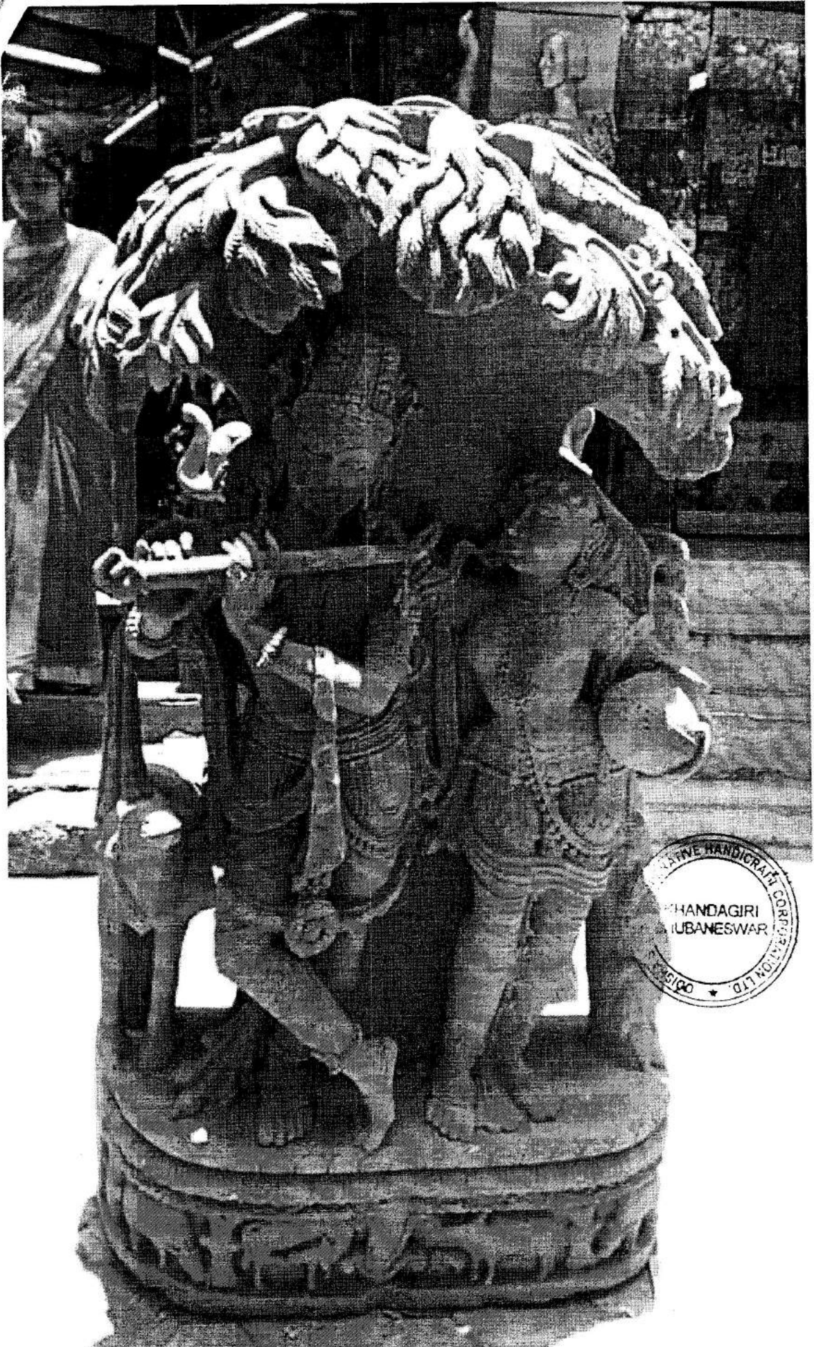
Quartz Stone Krishna with Nandi - Handicraft - Orissa